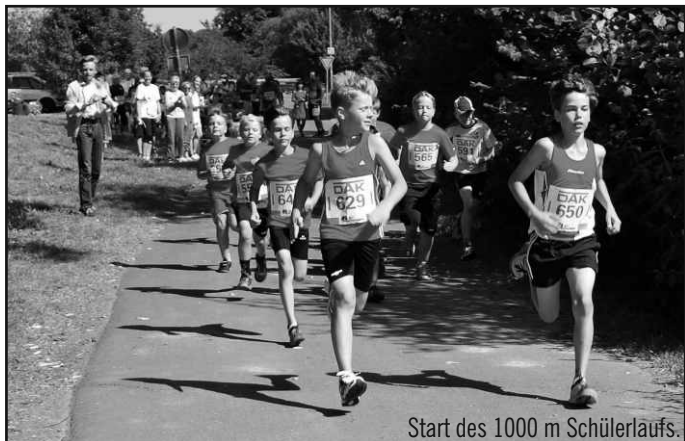
Start des 1000 m Schülerlaufs.